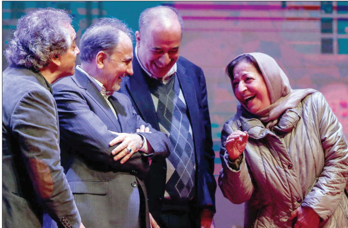
اختتامیه جشنواره تئاتر شهر