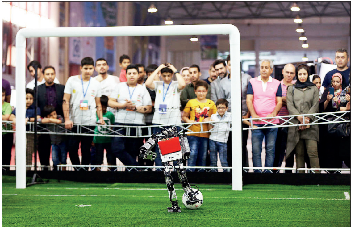
مسابقات روبو کاپ آسیا - اقیانوسیه با حضور ۱۵ کشور در کیش