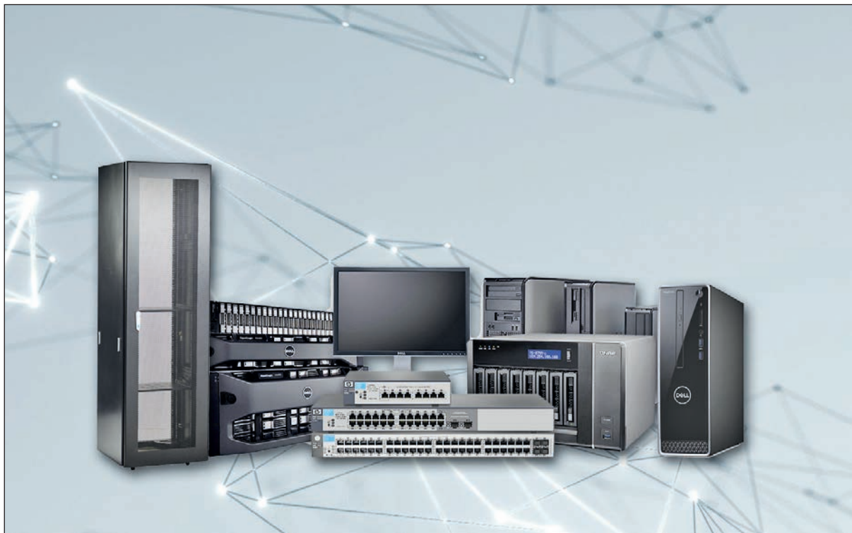
در صورت ادامه روند عدم تخصیص ارز به تجهیزات فناوری اطلاعات و ارتباطات، در آینده نزدیک شاهد اختلالات گسترده‌ای خواهیم بود

همچنین پس از برگزاری سومین نشست مشترک این کمیته، دومین بیانیه «سنا» منتشر شد. در این بیانیه آمده است: «این کمیته در راستای احترام به حقوق مردم در خصوص استفاده بهر مندی از مزایای ارزشمند فاوا هشدار می‌دهد که در صورت ادامه روند عدم تخصیص ارز به تجهیزات فناوری اطلاعات و ارتباطات در آینده نزدیک شاهد اختلالات گسترده‌ای در سطح ملی خواهیم بود. همانطور که اخیراً مشاهده شد، تنها با اختلال در کارکرد سرورهای یکی از کارگزاری‌های بورس چه میزان خسارت مستقیم و غیر مستقیم، سرمایه‌مقاضیان را تحت تاثیر قرار داد. سوال قابل تامل این است که در صورت بروز مشکلاتی در سطح وسیع تر چه آشفتگی در بازار سرمایه و حجم کلی معاملات رخ می‌دهد؟ همچنین با قطع تنها یک