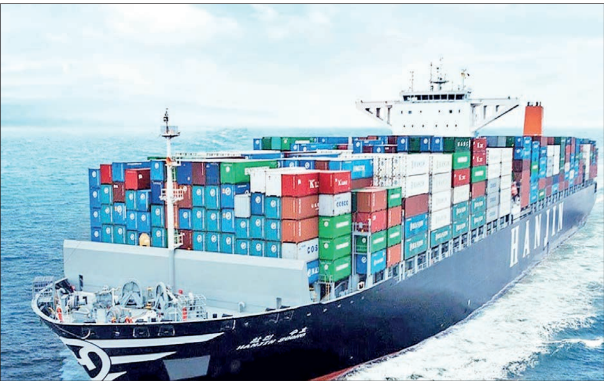
صادرات در سه ماهه اول سال جاری از واردات عقب‌ماند

است که هیچگاه استراتژی مشخصی در این زمینه اتخاذ نشده که کشور را به سمت تولیدات با کیفیت با هدف توسعه صادرات غیر نفتی سوق دهد. طبیعی در عین حال به مشکلات و چالش‌ها در مسیر توسعه صادرات اشاره می‌کنند می‌گویند: نداشتن بازار هدف و شرکای استراتژیک، ضربه‌های زیادی به صادرات وارد کرده است. اما عامل بیرونی، همان اعمال تحریم‌هایی است که مانع از حضور آسان و راحت ایران در بازارهای جهانی شده است.