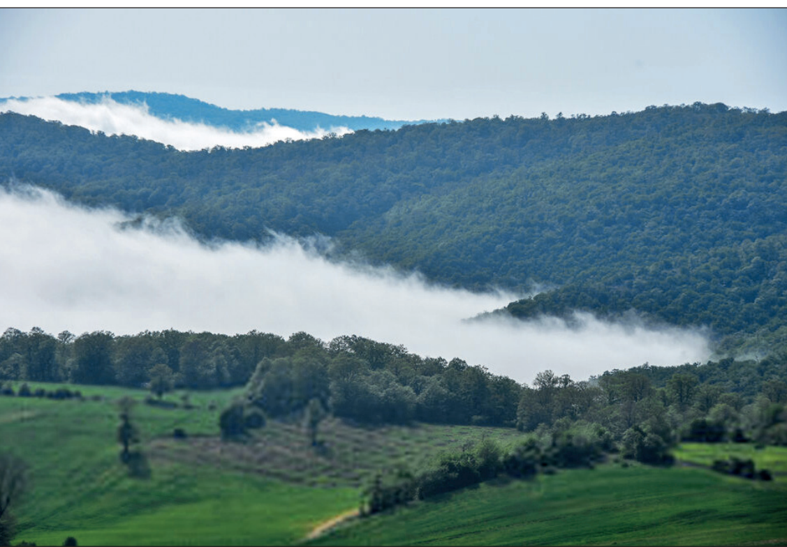
عکس از استان

جنگل زیبا و سرسبز «دشت شاد» در بخش کالپوش شهرستان میامی و در فاصله حدود ۱۲۰ کیلومتری از شهرستان میامی و فاصله حدود ۳۵۰ کیلومتری شمال شرقی از مرکز استان سمنان در فاصله کمتر از ۵ کیلومتری از روستایی به همین نام قرار دارد، همچنین روستاهای حسین آباد، سوداغلن، نام‌نیک، نردین و… از جمله روستاهای دیگر بخش کالپوش هستند که در همسایگی و ستا و جنگل دشت شاد قرار دارند. جنگل دشت شاد در مرز مشترک با سه استان سمنان، خراسان شمالی و گلستان قرار دارد، پوشش گیاهی غالب منطقه جنگلی است و گونه‌های درختی آن جز در ختان جنگلی پهن برگ خزری محسوب می شوند. همچنین گونه‌های متنوعی از جانوران را در ده‌های مختلف مانند پستانداران، پرندگان، خزندگان، دوزیستان و ماهی هادر جنگل دشت شاد یافت می شود.