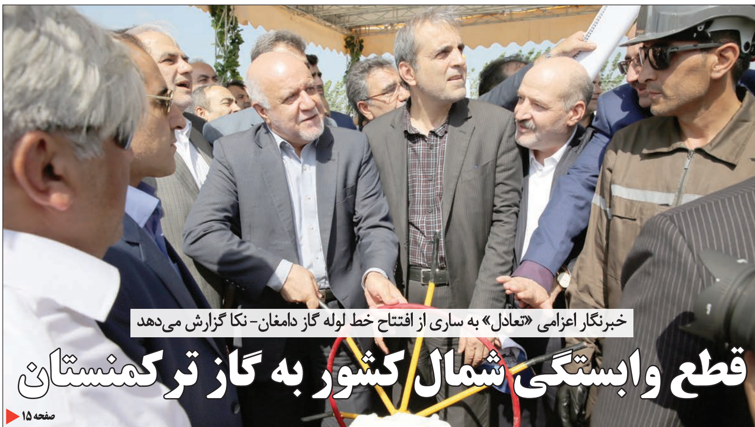
خبرنگار اعزامی «تعادل» به ساری از افتتاح خط لوله گاز دامغان - نکا گزارش می‌دهد