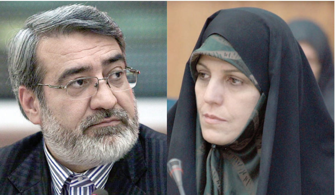
گروه اقتصاد اجتماعی |

وزارت کشور دیروز میزبان نشست هم‌اندیشی زنان فعال اقتصادی بوده نشست با حضور وزیر کشور، معاون امور زنان رییس‌جمهوری، یکی از اعضای فراکسیون زنان مجلس و مشاور وزیر کشور در امور زنان. وزیر کشور در این نشست بر ضرورت وضعیت اقتصادی کشور، تولید و اشتغال را دو اولویت اصلی اقتصاد ایران دانست که همچون دولت یازدهم، اولویت دولت دوازدهم هم خواهد بود. او سپس در ادامه سخنانش، بر ضرورت تمرکز فعالیت‌های زنان در دو حوزه فرهنگی و اقتصادی سخن گفت و تأکید کرد: فضای کسب و کار ایران تفاوتی میان زنان و مردان قائل نیست. معاون امور زنان و خانواده رییس‌جمهوری اما، نبود تعادل جنسیتی را ویژگی اصلی فضای کسب و کار ایران دانست و با طعنه‌یی از بی‌گفت‌وگوهای سیاسی این‌روزها بی‌پرامون حضور زنان در کابینه دولت بعد، گفت که «امروز چرایی حضور زنان، مهم‌تر از چگونگی حضور آنان شده است.» مشاور وزیر کشور هم در پایان این نشست به ارائه آمار مشارکت زنان در کسب و کار پرداخت؛ آماري که بیش از سخنان رییس، تأییدی بود در آنچه مولودری بر آن پای افشرده بود.