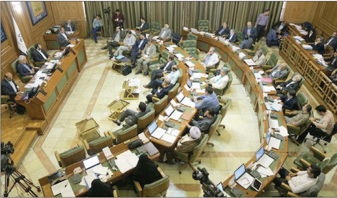
شماره ۱۰۰ درصد آرا شکایت خواهیم کرد.

وی با انتقاد از ارائه گزارش حسابرسی در صحن شورای شهر تهران گفت: به هیچ عنوان این گزارش محسوب نمی‌شود و می‌توان آن را یک قرأت دانست چراکه باید گزارش تحلیل و محتوا داشته باشد. جدیدی از اعضای شورای پنجم خواست تا نسبت به