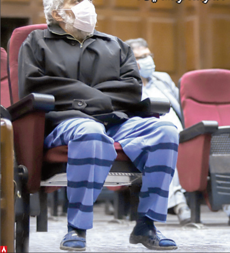
دومین جلسه دادگاه ۲۲ متهم پرونده فساد اقتصادی برگزار شد

از قاضی منصوری و طبری تا مغز متفکر تشکیلات