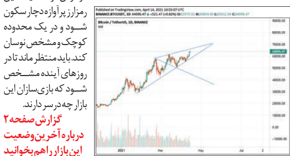
گزارش صفحه ۲ درباره آخرین وضعیت این بازار را در صفحه ۲