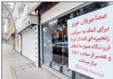
همیشه برای کمک به بزرگترین و کوچکترین اصناف و بازرگانان ایران

آرایشگاه های زنانه و مردانه» از جمله صنفی هستند که در فهرست حمایت دولت قرار گرفته اند. زبیر این صنف به دستور دولت و به اجبار تعطیل شده اند. وی با تأکید بر اینکه اگر شرایط وضعیت مالی کشور بهتر شد، قطعاً حمایت از سایر صنف در برنامه دولت قرار دارد، خاطرنشان کرد: نمی توان سایر مشاغل از جمله ایران گردی و جهانگردی، بخش های خصوصی آموزش و پرورش و رانندگی گرفت زیرا این مشاغل هنوز مجوز شروع