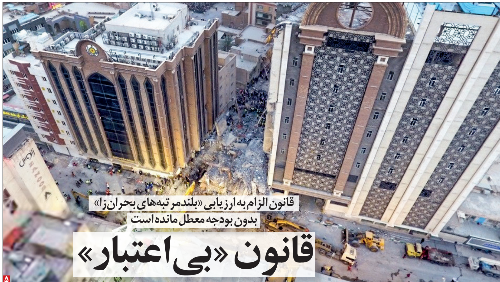
قانون الزام به ارزیابی «بلندمرتبه‌های بحران‌زا» بدون بودجه معطل مانده است