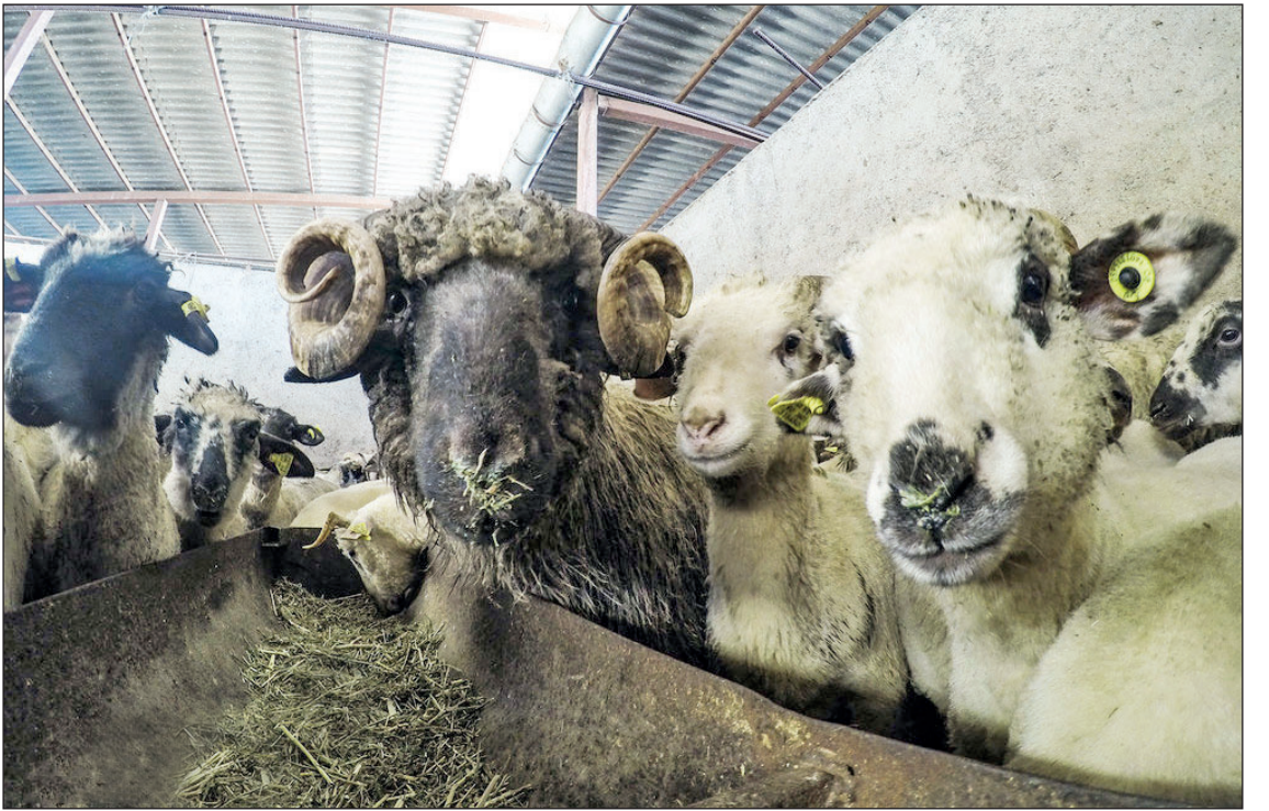
رود ۲ هزار گوسفند رومانیایی به تهران