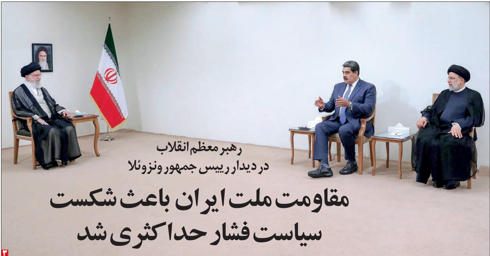
رهبر معظم انقلاب در دیدار رییس جمهور ونزوئلا

دو روز پس از ارسال این نامه در ۲۴ اسفندماه ۱۴۰۰ با ارسال نامه ای به معاون ارزی بانک مرکزی اعلام شد: «گروه صنعتی انتخاب الکترونیک از مان در خصوص بیان مشکلات تخصیص ارز جهت واردات اجزا و قطعات مورد نیاز خطوط تولید مطالبی را مطرح کرده است نظر به اهمیت ولزوم فراهم سازی بستر مناسب به منظور تداوم روند فعالیت های تولیدی و اشتغال واحد خواهشمند است دستور فرمایید جهت تسریع در تخصیص... ادامه در صفحه ۸