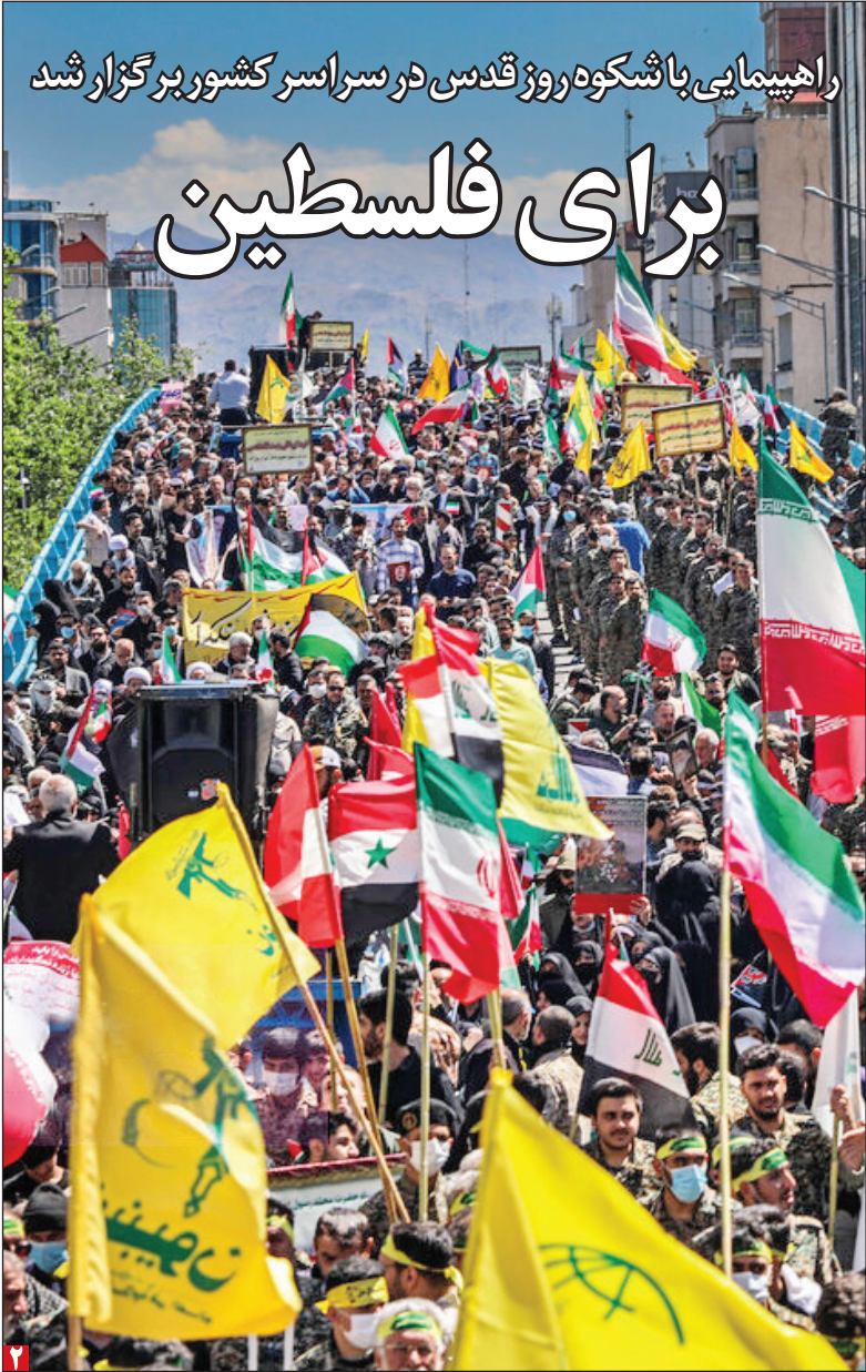
راهپیمایی با شکوه روز قدس در سراسر کشور برگزار شد