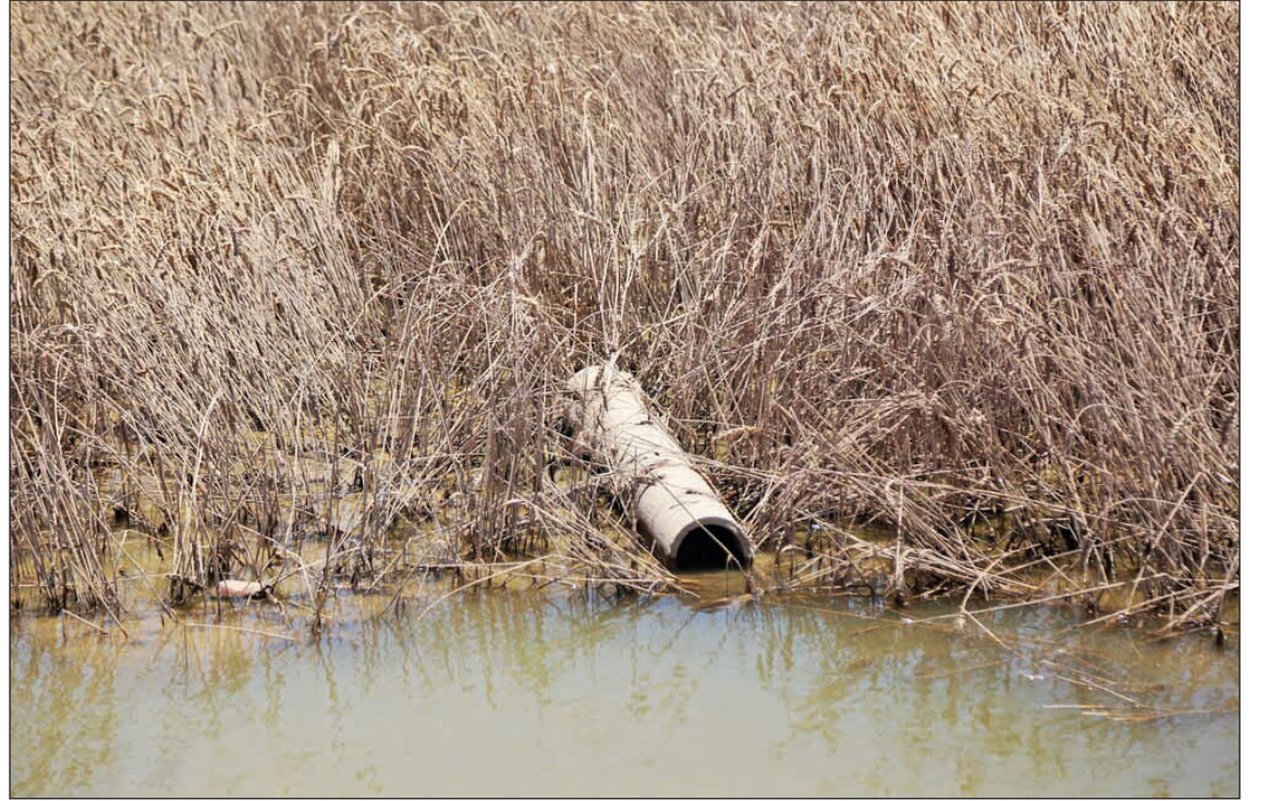
خسارات سیل به ۲۰۰ هکتار از گندمزارهای خوزستان