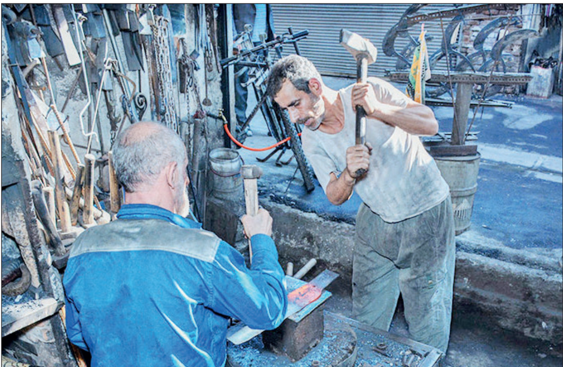
جدال پتک و آهن آهنگری سنتی، بازار مسگرهای قزوین

صاحب‌امتیاز: موسسه رسانه نگاران خوب اندیش مدیرمسئول: الیاس حضرتی سر‌دبیر: منصور بیطرف نشانی: خیابان ستارخان - خیابان کوثر دوم - بن‌بست مینو تلفن: ۶۶۴۲۰۷۶۹ - نمابر: ۶۶۴۲۰۴۱۷ چاپ: همشهری ۳ (روز‌تاب) - توزیع: نشر گستر امروز - تلفن: ۶۱۹۳۳۰۰۰ سازمان شهرستان‌ها: ۶۶۱۳۶۰۸۸ اذان ظهر: ۱۱:۴۹ | اذان مغرب: ۱۷:۴۵ | اذان صبح فردا: ۴:۴۹ info@taadolnewspaper.ir مرامنامه اخلاقی روزنامه تعادل در وبسایت رسمی روزنامه در دسترس است