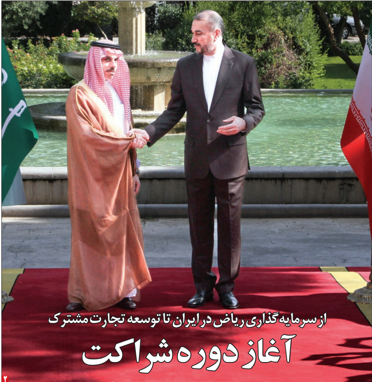
از سرمایه گذاری ریاض در ایران تا توسعه تجارت مشترک