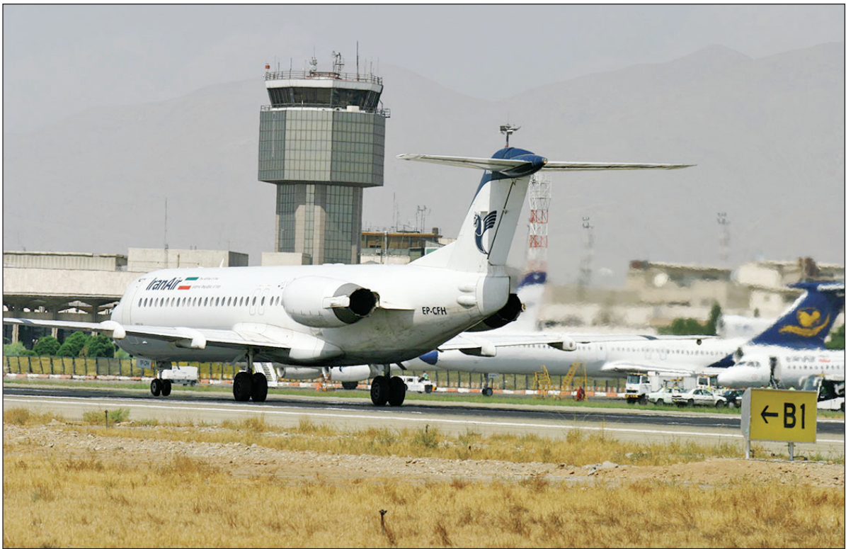
هواپیمای بوئینگ ۷۳۷ شرکت هواپیمایی ایران

این هواپیمای ضمن به پایان رساندن چک‌های سنگین در سطح کارخانه سازنده و بررسی‌های دوره‌ای با تلاش شبانه‌روزی متخصصین شرکت صنایع هواپیمایی ایران (صها)، متخصصین و مهندسین شرکت هواپیمایی کاسپین، پس از انجام تمام تست‌های زمینی و پروازی گرد، همواره در مذاکرات دیپلماتیک در زمره یکی از موارد و مسائل مورد مذاکره قرار داشته است و در سال‌های ۱۴۰۰ به بعد، گاه‌گه صحبت از بازگشت ظرفین، به «برجام» مطرح می‌شد، مسوولان سازمان هواپیمایی کشوری از پیگیری قرار دادهای برجلمی، در صورت توافق خبر می‌دادند، این‌بار اما مسوولان صنعت هوایی در این باره، سکوت کرده‌اند، اما به نظر می‌رسد، انجام برخی تعمیراتی که مستلزم قطعات مهمی همچون موتور هواپیماست، در سایه توافق موقت تفاهم با امریکا میسر شده‌است.